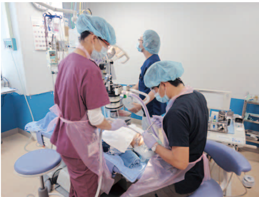
全身麻酔下歯科治療の様子

院外からの紹介は、精神遅滞や発達障害の患者さん、低年齢で多数歯齲蝕(齲蝕=むし歯)に罹患した定型発達児など、特に行動管理上全身麻酔が適応になる患者さんが多く受診しています。最近では口腔外科症例(口唇口蓋裂、正中過剰埋伏歯、舌小帯短縮症、粘液嚢胞、親知らずの抜歯)の患者さんも多く受診しています。中でも口唇口蓋裂に関しては、出生後早期に哺乳床を作製し、経口哺乳が可能となる症例が増加しています。