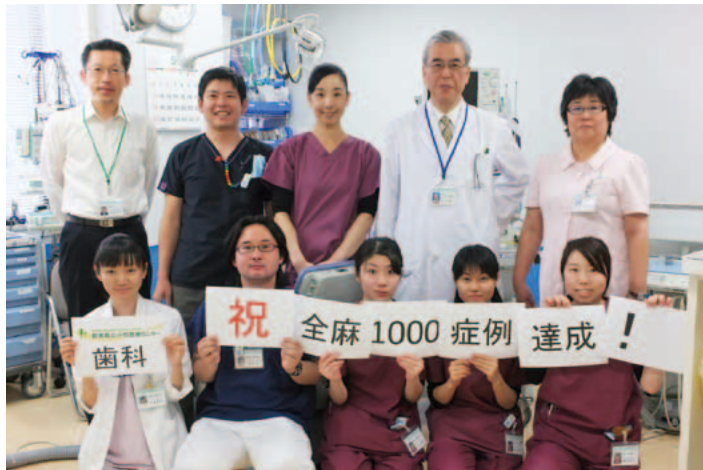
全身麻酔下歯科治療通算1000症例達成(平成26年5月8日)

今後もこれまでと同様に診療時の安全性を担保し、患者さんやご家族に安心、安全な歯科医療を提供できるような診療体制を整備、維持していきたいと思えます。県内唯一の障害児・有病児に特化した三次歯科医療機関として、これからも皆さんの期待に応えられるよう努力していきたいと思えます。